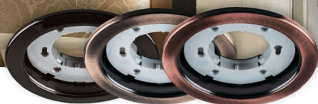
Арт. 28947 черный хром