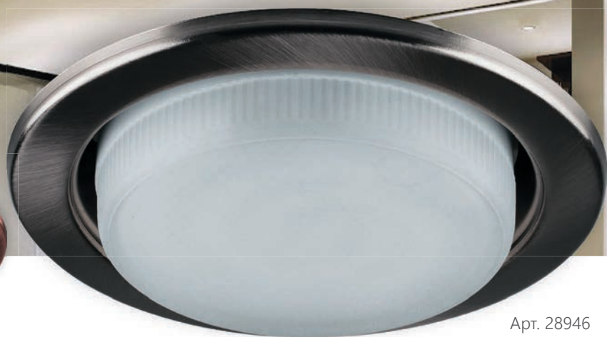
Арт. 28946 титан