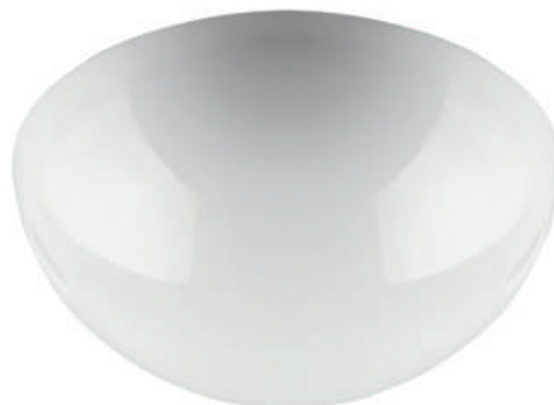
НБП 06-60-102 арт. 32275

Накладные светильники Feron НБП 06-60-101 и НБП 06-60-102 с фото-шумовым датчиком предназначены для общего освещения подсобных, промышленных, производственных помещений, а также применяются в сфере ЖКХ (подъезд, крыльцо, подвал и т.д.).