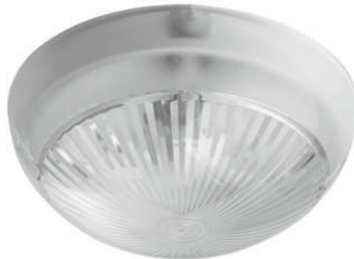
НБП 06-60-101 арт. 41400