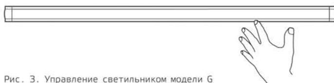
Рис. 3. Управление светильником модели G