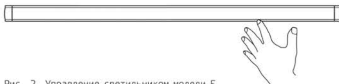
Рис. 2. Управление светильником модели F