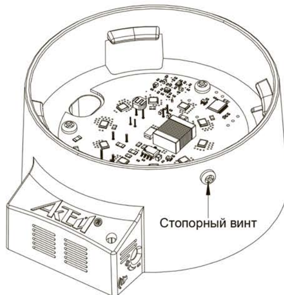
Рисунок 1 — Внешний вид основания СА-26

1.6 Климатическое исполнение УХЛ, категория размещения 3.1 по ГОСТ 15150-69, при этом высота над уровнем моря не должна превышать 2000 м.