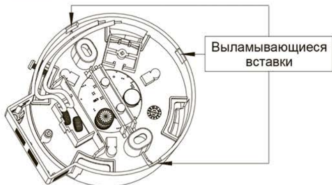
Рисунок 3 — Расположение выламываемых вставок