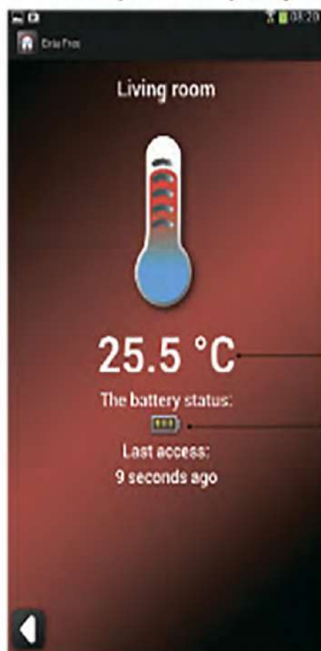
Представление датчика в мобильном приложении

RCT-01 универсальный беспроводной датчик температуры с батарейным питанием. Протокол работы согласно устройств Exta Free. Датчик работает только с контроллерами EFC-01 и EFC-02. В случае работы с EFC-02 возможна только визуализация значения температуры на мобильном устройстве. При работе с EFC-01, измеряемое значение температуры можно дополнительно использовать в процессе управления, например в системах отопления и кондиционирования. Датчик характеризуется малыми размерами и приспособлен для монтажа в монтажной коробке. Разрешается также настенный монтаж при помощи двухсторонней клеящей ленты или монтажного клея.