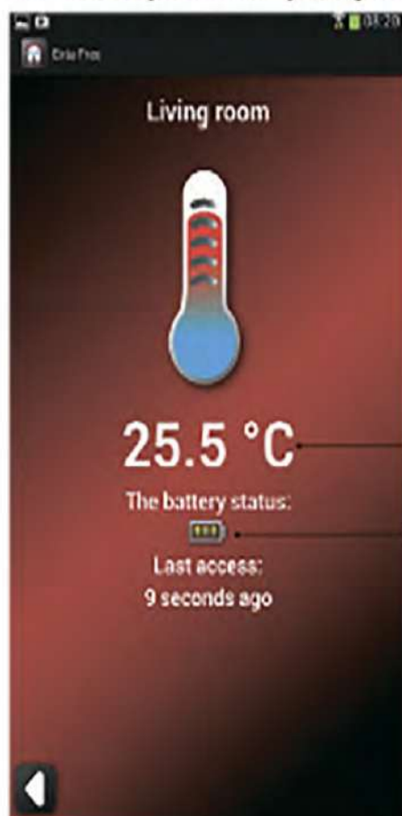
Представление датчика в мобильном приложении

RCT-01 универсальный беспроводной датчик температуры с батарейным питанием. Протокол работы согласно устройств Exta Free. Датчик работает только с контроллерами EFC-01 и EFC-02. В случае работы с EFC-02 возможна только визуализация значения температуры на мобильном устройстве. При работе с EFC-01, измеряемое значение температуры можно дополнительно использовать в процессе управления, например в системах отопления и кондиционирования. Датчик характеризуется малыми размерами и приспособлен для монтажа в монтажной коробке. Разрешается также настенный монтаж при помощи двухсторонней клеящей ленты или монтажного клея.