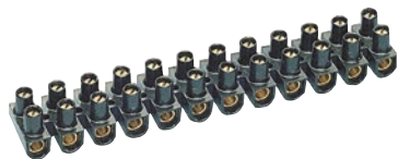
0 342 19