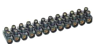
0 342 17