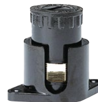
0 340 45