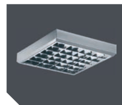
Цвет корпуса – металлик

Зеркальная бипараболическая решетка изготовлена из алюминия марки MIRO. Устанавливается в корпус скрытыми пружинами.