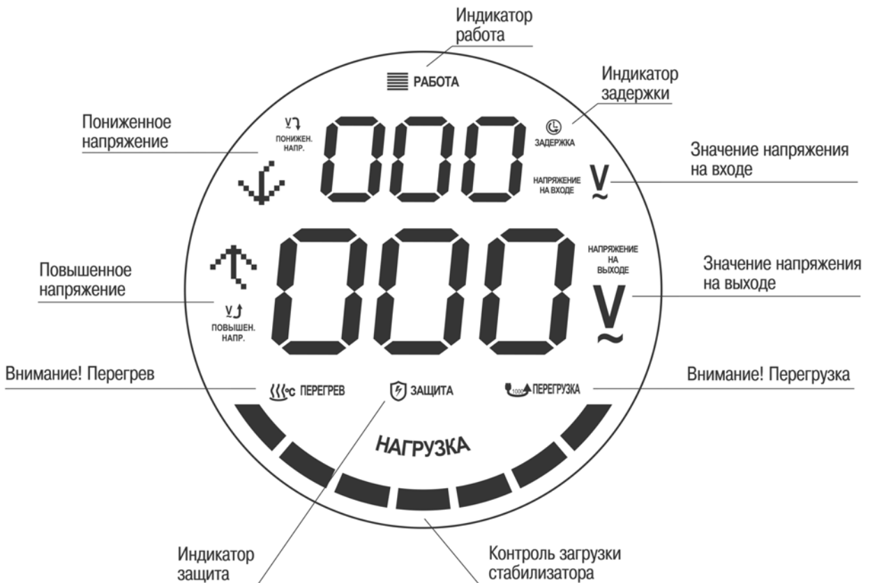
Рис 3. Индикация режимов работы переносных стабилизаторов