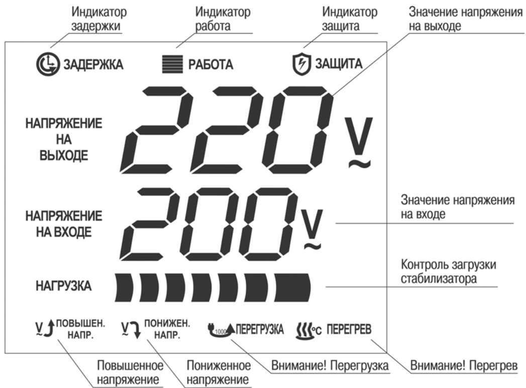
Рис 2. Индикация режимов работы настенных стабилизаторов