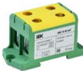
КВС 16-95 мм 2 Двухрядная

YZN13-095-K03 YZN13-095-K07 YZN23-095-K52