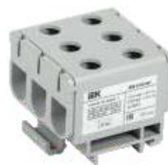
КВС 6-50 мм 2 Трехрядная серая

YZN13-095-K03 YZN13-095-K07 YZN23-095-K52