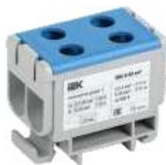
КВС 6-50 мм 2 Двухрядная

YZN13-050-K03 YZN13-050-K07 YZN23-050-K52