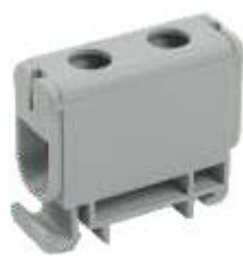
КВС 6-50 мм 2

YZN12-050-K03 YZN12-050-K07 YZN22-050-K52