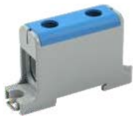
КВС 16-95 мм 2

YZN12-095-K03 YZN12-095-K07 YZN22-095-K52