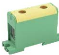
КВС 35-150 мм 2

YZN12-150-K03 YZN12-150-K07 YZN22-150-K52