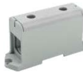
КВС 35-240 мм 2

YZN12-240-K03 YZN12-240-K07 YZN22-240-K52