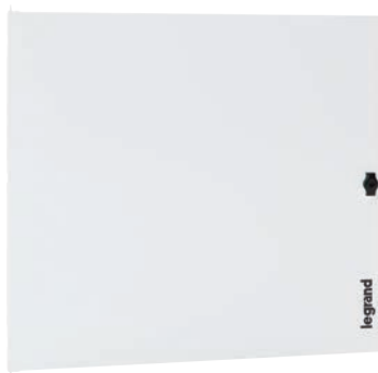
3 372 64