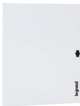
3 372 54