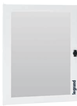
3 372 74