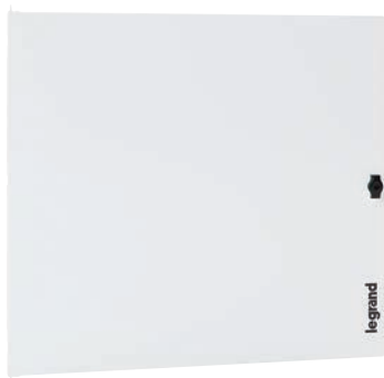
3 372 64