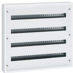
3 372 14

распределительные шкафы в металлическом корпусе, готовые к эксплуатации