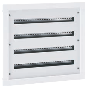
3 372 34

Шкафы поставляются с 1-м смонтированными рейками (расстояние между точками крепления 150 мм) и лицевой панелью на всю высоту шкафа