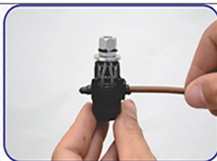
2. Подключение абонентского провода и установка изолированного колпачка