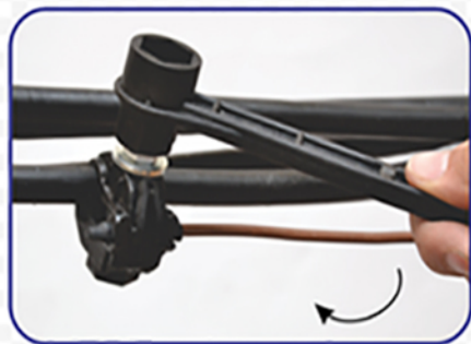
4. Затяжка верхней части головки на зажиме с помощью изолированного ключа ОК 13, в направлении по часовой стрелке