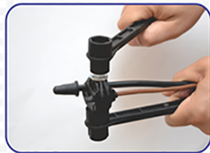
6. Для подключения абонента к магистрали сечением менее 35 мм 2 используется изолированных ключ ОК 13 и ОК 19