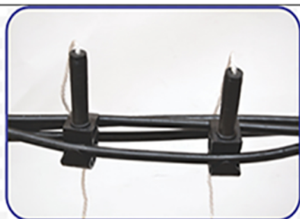
1. Выделение одной жилы из СИП