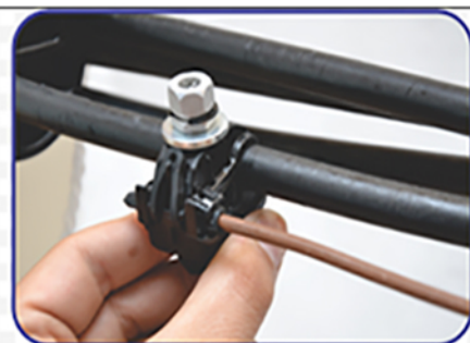
3. Монтаж зажима на магистральный провод