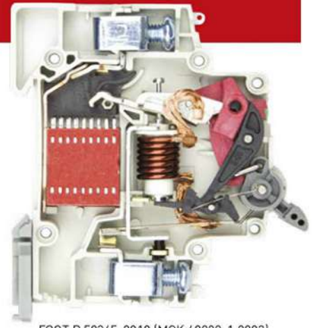
ГОСТ Р 50345-2010 (МЭК 60898-1:2003) Патент на опломбировку № 57543

Автоматические выключатели ВА 47-63 4,5 кА EKF PROxima являются механическими коммутационными аппаратами, производятся в одно-, двух-, трех- и четырехполюсном исполнении и соответствуют ГОСТ Р 50345-2010. Особенностью данной серии выключателей является усовершенствованная конструкция. В выключателях имеются пластиковые крышки, закрывающие доступ к винтовому зажиму и служащие для опломбирования выключателей, что исключает несанкционированный доступ к проводникам. Корпус выключателей усилен дополнительными заклепками для устранения эффекта расхождения корпуса. Выключатели оборудованы удобной ручкой управления, обеспечивающей надежное оперирование изделиями. На лицевой панели выключателей имеется цветовой индикатор состояния. Конструкция установочного зажима обеспечивает свободную установку выключателя на DIN-рейку.