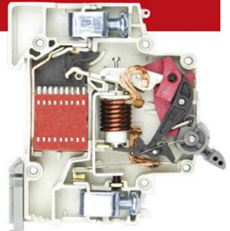
ГОСТ Р 50345-2010 (МЭК 60898-1:2003) Патент на опломбировку № 57543

Автоматические выключатели ВА 47-63 4,5 кА EKF PROxima являются механическими коммутационными аппаратами, производятся в одно-, двух-, трех- и четырехполюсном исполнении и соответствуют ГОСТ Р 50345-2010. Особенностью данной серии выключателей является усовершенствованная конструкция. В выключателях имеются пластиковые крышки, закрывающие доступ к винтовому зажиму и служащие для опломбирования выключателей, что исключает несанкционированный доступ к проводникам. Корпус выключателей усилен дополнительными заклепками для устранения эффекта расхождения корпуса. Выключатели оборудованы удобной ручкой управления, обеспечивающей надежное оперирование изделиями. На лицевой панели выключателей имеется цветовой индикатор состояния. Конструкция установочного зажима обеспечивает свободную установку выключателя на DIN-рейку.