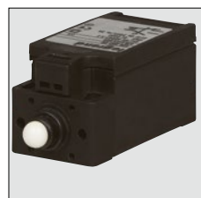
0 363 13