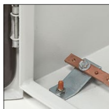
0 367 36 + 0 373 89 (стр. 345)