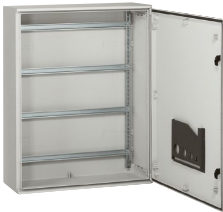
Полиэстеровые шкафы Marina