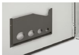
0 365 80