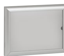
0 475 45