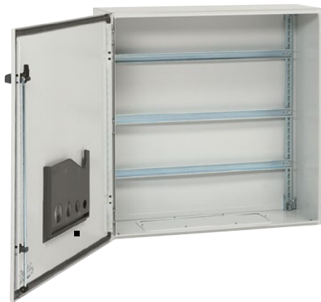
Металлические шкафы Atlantic