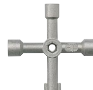
0 368 42