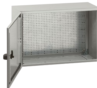
0 355 06 + 0 360 22 горизонтальный монтаж