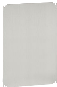
0 360 58