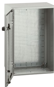
0 355 08 + 0 360 22 вертикальный монтаж