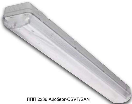
ЛПП 2х36 Айсберг-CSVT/SAN