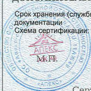
Схема сертификации: 4

Срок хранения (службы, годности) указан в прилагаемой к продукции товаросопроводительной и/или эксплуатационной документации