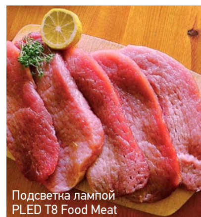
Подсветка лампой PLED T8 Food Meat