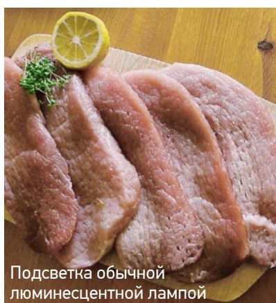
Подсветка обычной люминесцентной лампой