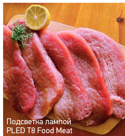
Подсветка лампой PLED T8 Food Meat