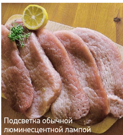
Подсветка обычной люминесцентной лампой