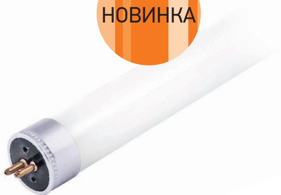
PLED T5-600GL 8w стеклянная колба