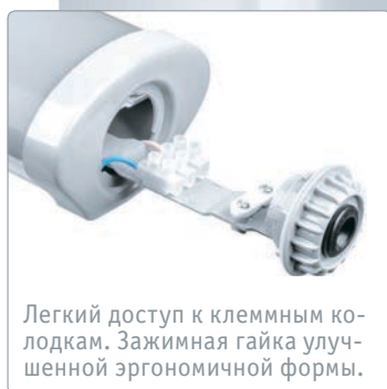
Легкий доступ к клеммным колодкам. Зажимная гайка улучшенной эргономичной формы.

Светодиодные пылевлагозащищенные светильники Navigator серии DSP-02-LED (аналог ЛСП) предназначены для освещения коммерческих и промышленных объектов. Данная модель отличается наличием специальной конструкции, которая обеспечивает легкий доступ к клеммным колодкам и герметичное подключение.