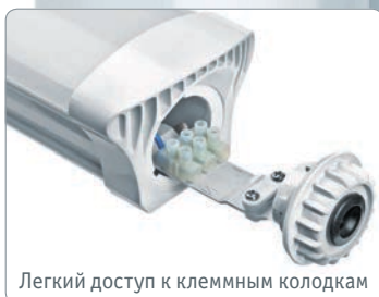
Легкий доступ к клеммным колодкам