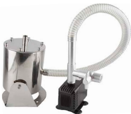
Фонтанная установка в сборе

Фонтанная установка с декоративной подсветкой FPL103 используют для создания водных уличных композиций - светящихся водяных арок.