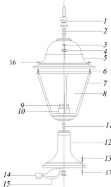
1 – балясина; 2 – резьбовое крепление; 3 – гровер; 4 – гайка; 5 – верхняя крышка; 6 – винты; 7 – каркас; 8 – стеклянный рассеиватель; 9 – патрон; 10 – ламподержатель; 11 – резьбовое крепление; 12 – постамент; 13 – винт; 14 – клеммник; 15 – провод защитного заземления; 16 – декоративная гайка.