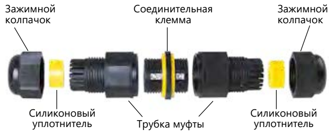
Схема соединительной муфты LD520/LD521