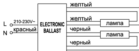
Рис. 3 Схема подключения ЭПРА EB53

4.2 Закрепите корпус прибора на монтажной поверхности при помощи винтов или двухстороннего температуростойкого скотча.