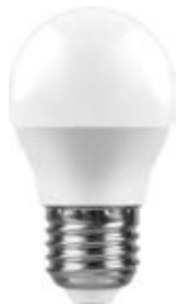
LB-38, LB-95, LB-550, LB-750 E27