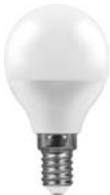
LB-95, LB-550, LB-750 E14