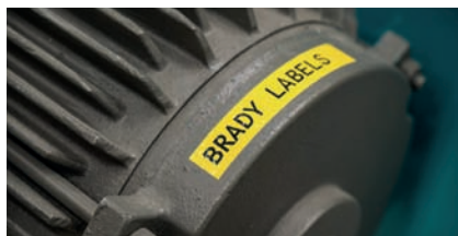
Суровые условия эксплуатации