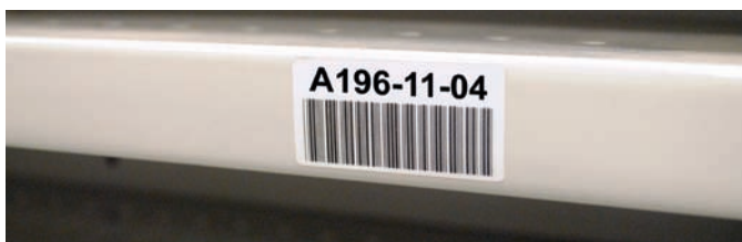
Визуализация рабочего места по системе 5S