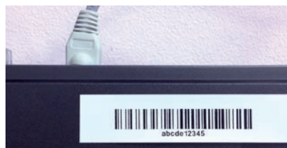
Использование вне помещений