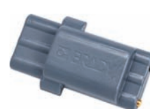
brd139540 Литий-ионная батарея