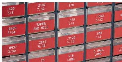
Ровная, гладкая поверхность