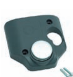
brd110891 Магнитная накладка