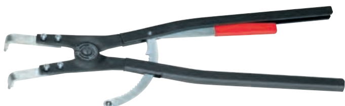
KN-4620A61 \angle 90^\circ