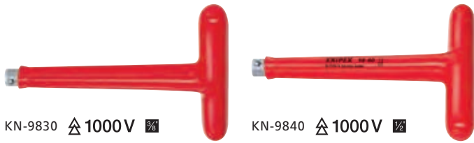
KN-9830 \triangle 1000 V \square