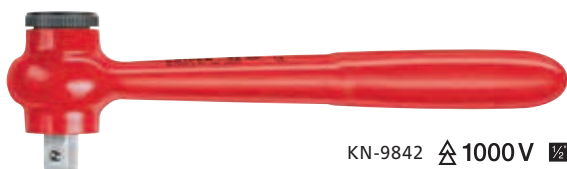
KN-9842 \triangle 1000 V \square

с внешним присоединительным квадратом 1/2"