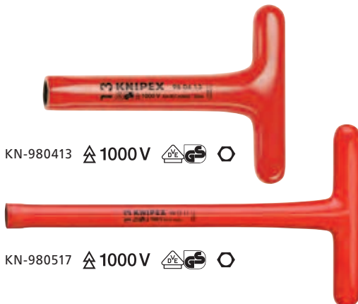
KN-980413 ⚡ 1000 V