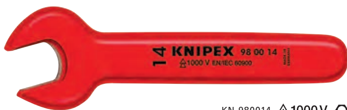
KN-980014 1000 V