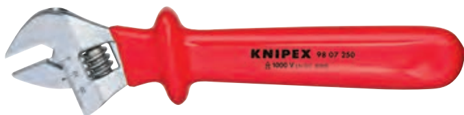
KN-9807250 1000 V 22°