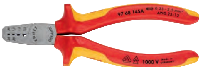
KN-9768145A 1000 V