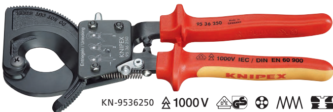
KN-9536250 \Delta 1000 V