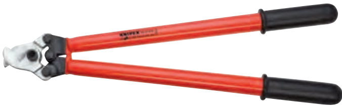
KN-9527600 \Delta 1000 V