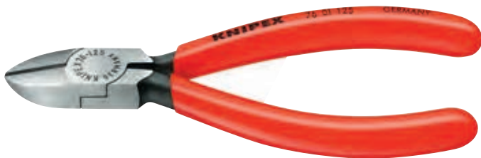
KN-7601125 ✂️ 🟢