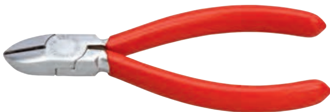
KN-7603125 ✂️ 🟢