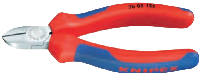
KN-7605125 ✂️ 🟢