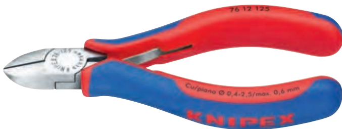
KN-7612125 ✂️ 🟢 📐