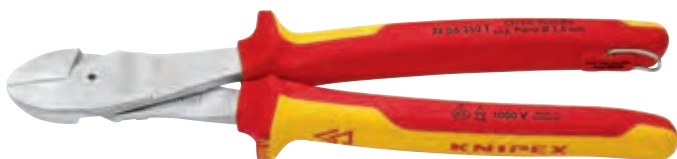
KN-7406250T 1000 V

Экономия усилия 20% по сравнению с обычными боковыми кусачками аналогичной длины.