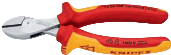
KN-7306160 1000 V