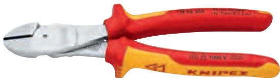
KN-7406200 1000 V