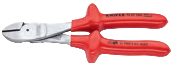
KN-7407200 1000 V