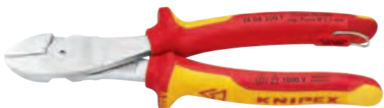
KN-7406200T 1000 V