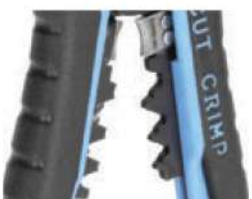
Модуль для опрессовки WS-11

Предназначен для опрессовки изолированных гильз и наконечников сечением от 0,5 до 6 мм 2 (НКИ, НИК, НВИ, ГСИ, НШКИ, НШПИ, изолированных разъемов), а так же неизолированных гильз и наконечников, в том числе и автоклемм