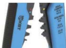
Модуль для опрессовки WS-04A

Возвратные пружины (2шт.) служат для возврата прижимных губок и рукояток в исходное положение