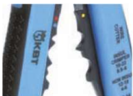
Модуль для опрессовки WS-07

Предназначен для опрессовки втулочных наконечников типа НШВ, НШВИ сечением от 0.5 до 6.0 мм 2