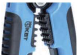
Модуль для опрессовки WS-04B

Предназначен для опрессовки изолированных гильз и наконечников сечением от 0,5 до 6 мм 2 (НКИ, НИК, НВИ, ГСИ, НШКИ, НШПИ, изолированных разъемов) и неизолированных гильз и наконечников сечением от 0,5 до 6 мм 2 (ГМЛ, ГМЛ(о), ТМ, ТМЛ, ТМЛ(о), автоклемм)