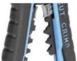
Модуль для опрессовки WS-11

Предназначен для опрессовки изолированных гильз и наконечников сечением от 0,5 до 6 мм 2 (НКИ, НИК, НВИ, ГСИ, НШКИ, НШПИ, изолированных разъемов), а так же неизолированных гильз и наконечников, в том числе и автоклемм