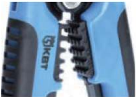
Модуль для опрессовки WS-04B

Предназначен для опрессовки изолированных гильз и наконечников сечением от 0,5 до 6 мм 2 (НКИ, НИК, НВИ, ГСИ, НШКИ, НШПИ, изолированных разъемов) и неизолированных гильз и наконечников сечением от 0,5 до 6 мм 2 (ГМЛ, ГМЛ(о), ТМ, ТМЛ, ТМЛ(о), автоклемм)