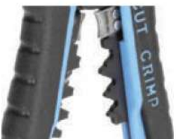
Модуль для опрессовки WS-11

Предназначен для опрессовки изолированных гильз и наконечников сечением от 0,5 до 6 мм 2 (НКИ, НИК, НВИ, ГСИ, НШКИ, НШПИ, изолированных разъемов), а так же неизолированных гильз и наконечников, в том числе и автоклемм