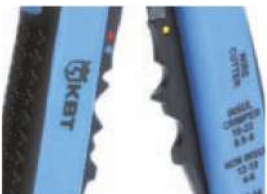
Модуль для опрессовки WS-07

Предназначен для опрессовки втулочных наконечников типа НШВ, НШВИ сечением от 0.5 до 6.0 мм 2