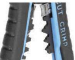
Модуль для опрессовки WS-11

Предназначен для опрессовки изолированных гильз и наконечников сечением от 0,5 до 6 мм 2 (НКИ, НИК, НВИ, ГСИ, НШКИ, НШПИ, изолированных разъемов), а так же неизолированных гильз и наконечников, в том числе и автоклемм