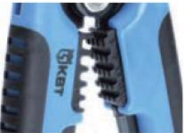
Модуль для опрессовки WS-04B

Предназначен для опрессовки изолированных гильз и наконечников сечением от 0,5 до 6 мм 2 (НКИ, НИК, НВИ, ГСИ, НШКИ, НШПИ, изолированных разъемов) и неизолированных гильз и наконечников сечением от 0,5 до 6 мм 2 (ГМЛ, ГМЛ(о), ТМ, ТМЛ, ТМЛ(о), автоклемм)