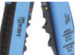
Модуль для опрессовки WS-07

Предназначен для опрессовки втулочных наконечников типа НШВ, НШВИ сечением от 0.5 до 6.0 мм 2