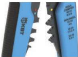
Модуль для опрессовки WS-04A

Возвратные пружины (2шт.) служат для возврата прижимных губок и рукояток в исходное положение