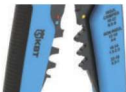
Модуль для опрессовки WS-04A

Возвратные пружины (2шт.) служат для возврата прижимных губок и рукояток в исходное положение