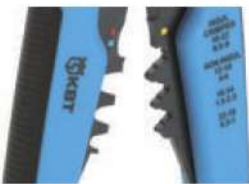
Модуль для опрессовки WS-04A

Возвратные пружины (2шт.) служат для возврата прижимных губок и рукояток в исходное положение