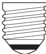
E27 IEC 7004-21