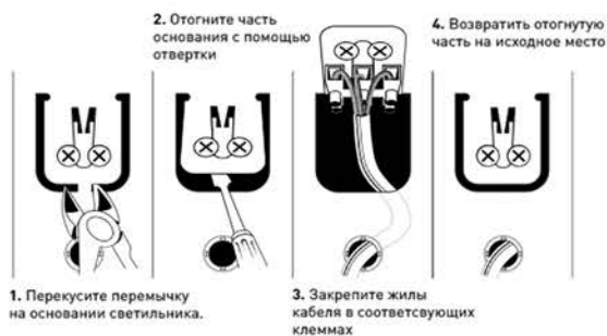
Рис.2. Схема подключения светильника SPO-6-36 к сети 220В.

3.3.3. После проверки правильности подключения можно включать сетевое напряжение.