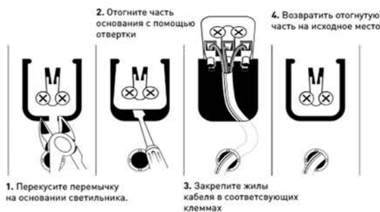
Рис.2. Схема подключения светильника SPO-6-36 к сети 220В.

3.3.3. После проверки правильности подключения можно включать сетевое напряжение.