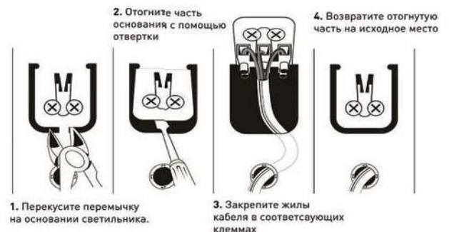
Рис.2. Схема подключения светильника SPO-6-36 к сети 220В.

3.3.3. После проверки правильности подключения можно включать сетевое напряжение.