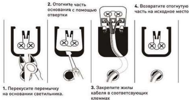
Рис.2. Схема подключения светильника SPO-6-36 к сети 220В.

3.3.3. После проверки правильности подключения можно включать сетевое напряжение.