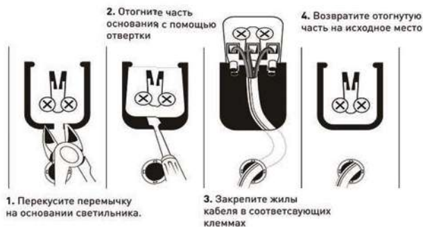
Рис.2. Схема подключения светильника SPO-6-36 к сети 220В.

3.3.3. После проверки правильности подключения можно включать сетевое напряжение.