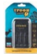
TR-120 Комплектация: ● 3.У.