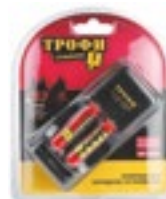
TR-920AAA Комплектация: ● 3.У. ● Аккумулятор HR03 800мАч