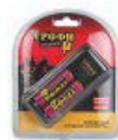
TR-920AA Комплектация: ● 3.У. ● Аккумулятор HR6 2500мАч