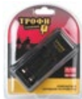
TR-920 Комплектация: ● 3.У.