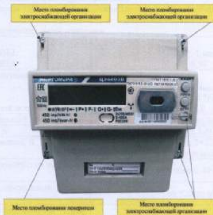
Рисунок 7 - Общий вид счетчика ЦЭ 6803В Р33