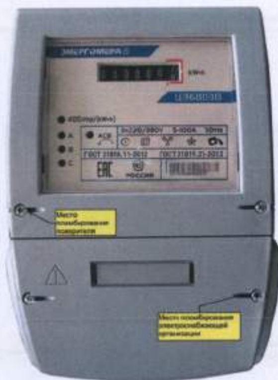
Рисунок 5 - Общий вид счетчика ЦЭ 6803В Ш35