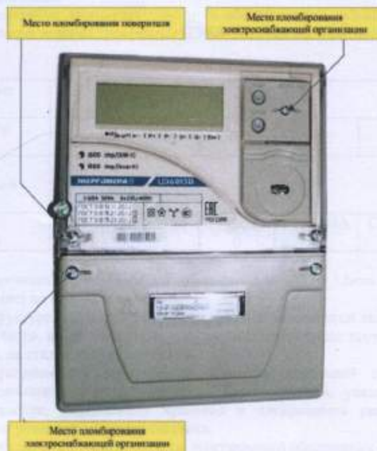
Рисунок 6 - Общий вид счетчика ЦЭ 6803В ШЗ1