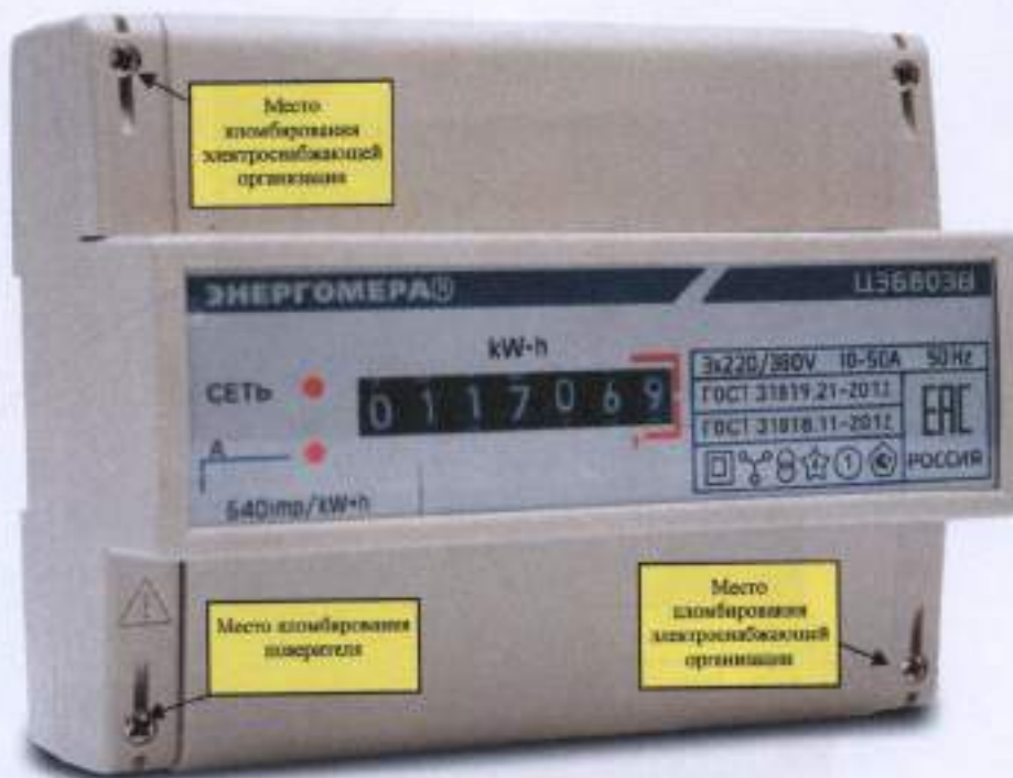
Рисунок 2 - Общий вид счетчика ЦЭ 6803В Р31