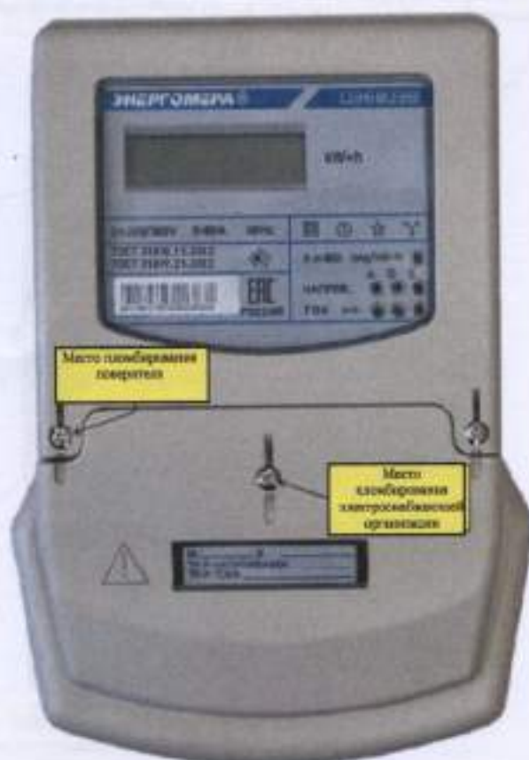
Рисунок 4 - Общий вид счетчика ЦЭ 6803В Ш35