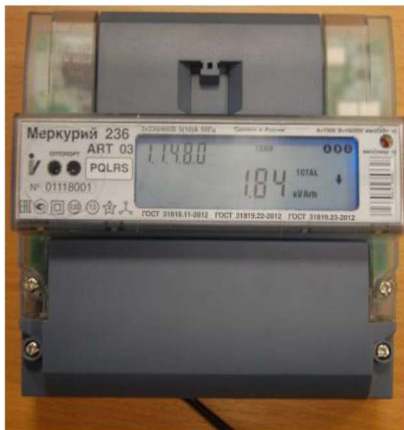
Рисунок 2 – Внешний вид счётчиков «Меркурий 236А(Р)(Т)...»

На рисунке 2 приведена фотография общего вида счётчиков «Меркурий 236А(Р)(Т)...».