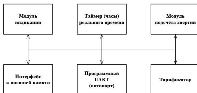
Рисунок 4 - Структура программного обеспечения «Меркурий 236»

Идентификационные данные программного обеспечения приведены в таблице 4.