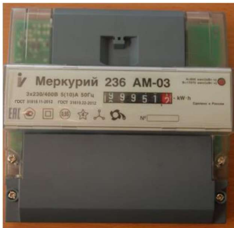
Рисунок 1 – Внешний вид счётчиков «Меркурий 236АМ-0Х»

Счётчики с жидкокристаллическим индикатором (ЖКИ) являются многотарифными и выпускаются с внешним или внутренним тарификатором и предназначены для учёта активной энергии прямого направления или активной энергии прямого направления и реактивной энергии прямого и обратного направления (таблица 2)